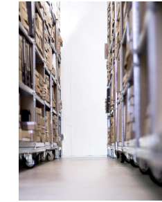
Abb. | Fig.: Die Schwarze Lade, 2018, Köln | Cologne

EXBODIMENT entsteht in Kollaboration mit BLACK KIT | DIE SCHWARZE LADE. Das lebendige, 1981 gegründete Archiv für internationale Performancekunst versteht sich als Impulsgeber in die Gegenwart. Es enthält ca. 4.000 Dossiers zu Künstler*innen der Performance-, Theater- und Sound-Art, 10.000 Fachpublikationen, Videos und Fotos unterschiedlicher Formate, Performance-Relikte und viele Regalmeter zu Netzwerken unterschiedlicher Kontinente.