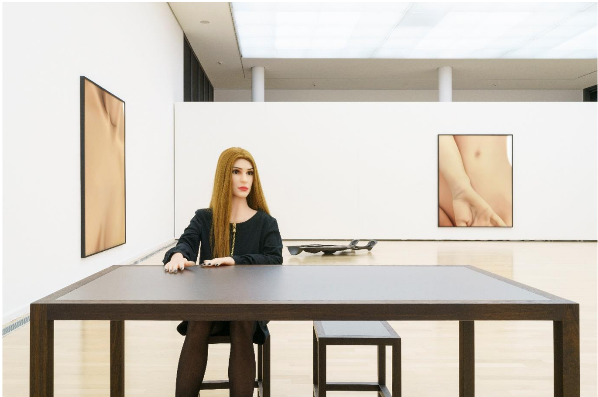
Installationsansicht Double Bind . Louisa Clement, Kunsthalle Gießen, 2021

im Rahmen der Ausstellung Double Bind . Louisa Clement