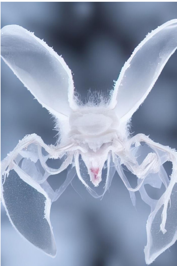
Abb.: Mary-Audrey Ramirez, Snow and PVC Birth, 2022 © Mary-Audrey Ramirez

Mit einer neuen Kooperation mit dem Panel on Planetary Thinking nimmt die Kunsthalle Gießen die komplexe Wechselwirkung zwischen dem Menschen und dem Planeten Erde in den Blick. Mit unserer Wiedereröffnung wird zudem die erfolgreiche Kooperation zwischen dem Stadtheater Gießen und der Kunsthalle neu aufgelegt.