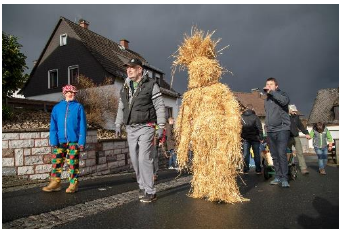
Abb.: Matthew Cowan: The Strawbear, 2019

Im Nachgang zu seiner Soloshow The Scream of the Strawbear wird Matthew Cowan's jüngst erschienene Online Publikation sowie seine neuen Editionen vorgestellt. In seinen Fotografien, Videos, Installationen und Performances beschäftigt sich der Neuseeländer mit europäischen Bräuchen und der Rolle, die sie heute spielen. Rituale, Kleider und Kostüme sind dabei zentral. Inmitten der ausgestellten kulturhistorischen Objekte des Oberhessischen Museums werden seine Editionen von ihm selbst