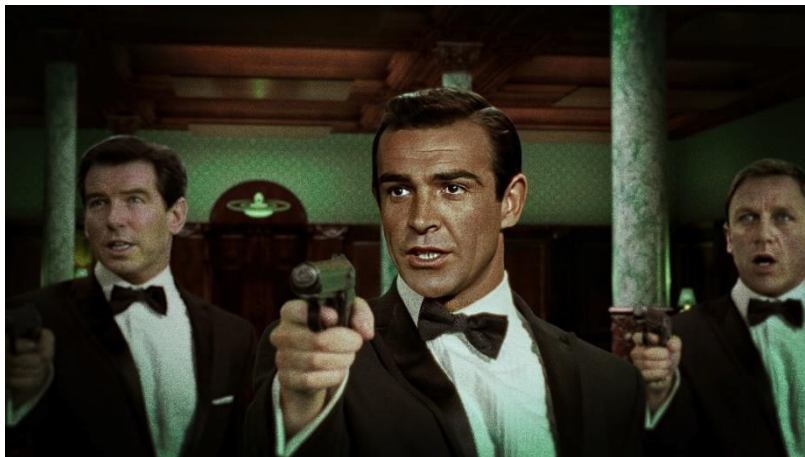
Abb.: Rachel Maclean: DUCK, film still, 2023, © Rachel Maclean

Im Juli verwandelt die Schottin Rachel Maclean (*1987 Edinburgh, GB; lebt in Glasgow, GB) die Kunsthalle Gießen in ein begehrtes Gesamtkunstwerk. Im Zentrum ihrer multimedialen Praxis stehen virtuelle Realitäten, Deepfakes und Fototechniken, mit denen sie grelle, fantastische Erzählungen zum Leben erweckt. Gespeist aus Politik und Popkultur entwickelt