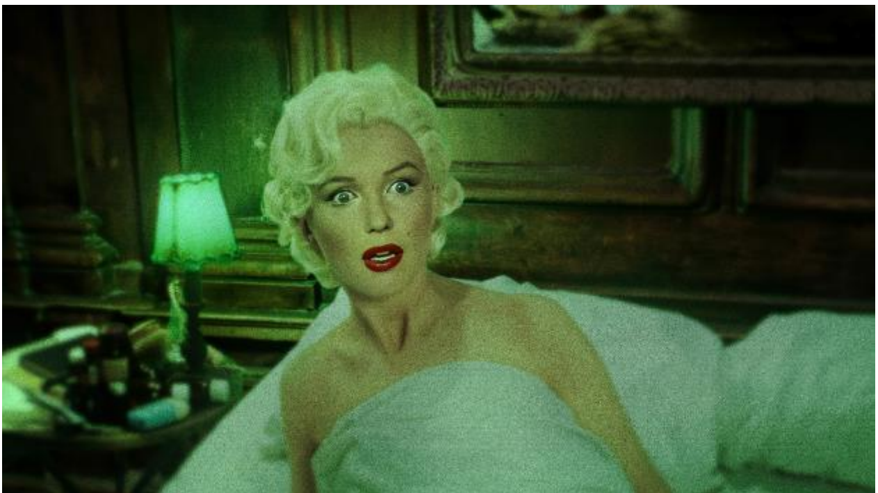
Abb.: Rachel Maclean: DUCK, film still, 2023, © Rachel Maclean

2024 präsentiert die Kunsthalle Giessen neben der bis zum 28. April laufenden Einzelschau A Journey You Take Alone mit Arbeiten der Britin Emma Talbot zwei weitere weibliche Positionen: Rachel Maclean und Raphaela Vogel . Auch werden im nächsten Jahr die beiden erfolgreichen Kooperationen mit dem Panel on Planetary Thinking und dem Stadttheater Giessen weitergeführt.