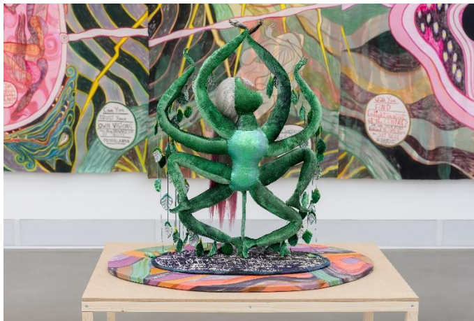
Abb.: Installationsansicht Emma Talbot. A Journey You Take Alone, Kunsthalle Giessen, 2023

Geburt und Tod – Beginn und Ende des menschlichen Lebens stehen im Mittelpunkt der Ausstellung A Journey You Take Alone von Emma Talbot (*1969 Stourbridge, GB; lebt in Reggio Emilia, IT und London, GB). In ihren dicht verwobenen Bildsequenzen auf Seide, in Videos