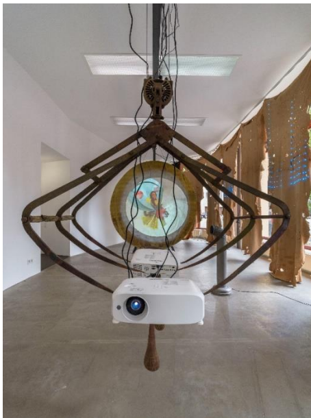
Abb.: Raphaela Vogel: Found Subject, 2023, Installationsansicht BQ, Berlin, Foto: Roman März, Berlin, Courtesy: BQ, Berlin + the artist

Im Zentrum des Schaffens von Raphaela Vogel (*1988 Nürnberg, lebt in Berlin) stehen skulpturale Ton- und Videocollagen sowie installative Arbeiten, die mit den architektonischen und natürlichen Gegebenheiten interagieren. Raumerfahrung bildet dabei einen essentiellen Bestandteil ihrer künstlerischen Praxis, wodurch Vogels Werke nie isoliert von ihrer Umgebung betrachtet werden können. Dabei verwendet die Künstlerin gerne gefundene Objekte, die sie weiterverarbeitet und zweckentfremdet. Vogel bricht so mit der ursprünglichen Funktion und verleiht ihnen eine neue Symbolkraft. Ihre Videowerke entwickelt die Künstlerin stets alleine: Sie filmt, schlüpft in verschiedene Rollen und produziert, wodurch Betrachter*innen mit der Intimität und Unmittelbarkeit der Künstlerin konfrontiert sind. Sie hat an der Akademie der Bildenden Künste Nürnberg bei Michael Hakimi und an der Städelschule in Frankfurt am Main bei Peter Fischli studiert. Nach Ausstellungen u.a. im