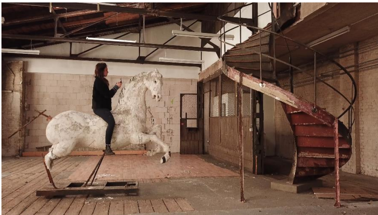
Abb.: Raphaela Vogel, Die Dressur des Raumes, 2024, Film Still.

Raphaela Vogels (*1988) Arbeiten sind oft in skulpturale wie installative Settings eingefügte Musik- und Soundcollagen und Videofilme. Dabei verwendet die Künstlerin gerne gefundene Objekte, Maschinen und Techniken sowie selbst produziertes Klang- und Bildmaterial. Ihre ebenso multimedialen wie multidisziplinären Werke interagieren mit den architektonischen und natürlichen Gegebenheiten von Ausstellungssituationen. Dem Publikum werden so besondere Raumerfahrungen ermöglicht, deren Bestandteile sich nicht ablösen und isoliert von ihrer spezifischen Umgebung betrachten lassen.