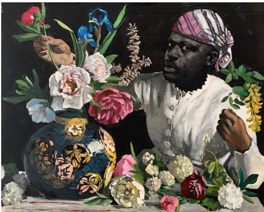
Abb.: Roméo Mivekannin, Young woman with peonies, after Frédéric Bazille, 2023, acrylic and elixir bath on canvas, 134x167cm.

In seiner ersten institutionellen Einzelausstellung in Deutschland verbindet Roméo Mivekannin (*1986) postkoloniale Themen mit der spirituellen Kraft des Voodoo. Er interpretiert Gemälde der europäischen Kunstgeschichte neu, indem er Gesichter durch sein eigenes Selbstportrait ersetzt und Archivmaterial nutzt, um den kolonialen Blick aufzudecken. Als Bildträger verwendet er alte Betttücher, die er Voodoo-Praktiken folgend in Elixier-Bädern einweicht, um spirituellen Widerstand sichtbar zu machen.