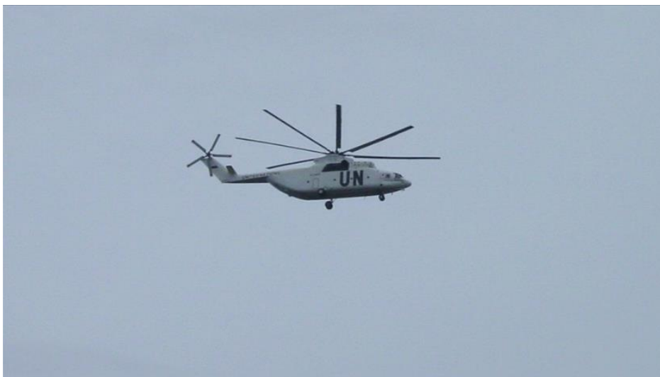
Abb.: Thomson&Craighead, A Short Film About War, 2009/2010, Filmstill, Courtesy of the artists.

Während Krieg und Gewalt in den Medien omnipräsent erscheinen, bleiben andere Formen von Gewalt weitgehend unsichtbar oder werden gezielt unsichtbar gemacht. Welche Machtstrukturen und Bildregime verbergen sich hinter diesen Mechanismen des Sicht- und Unsichtbarmachens von Gewalt? Die Gruppenausstellung in Kooperation mit dem Forschungsinstitut Transformation of Political Violence (TraCe) rückt diese Dynamiken in den Mittelpunkt. Sie führt Untersuchung fort, die bereits im Herbst 2024 im Symposium Darstellungen exzessiver Gewalt thematisiert wurde.