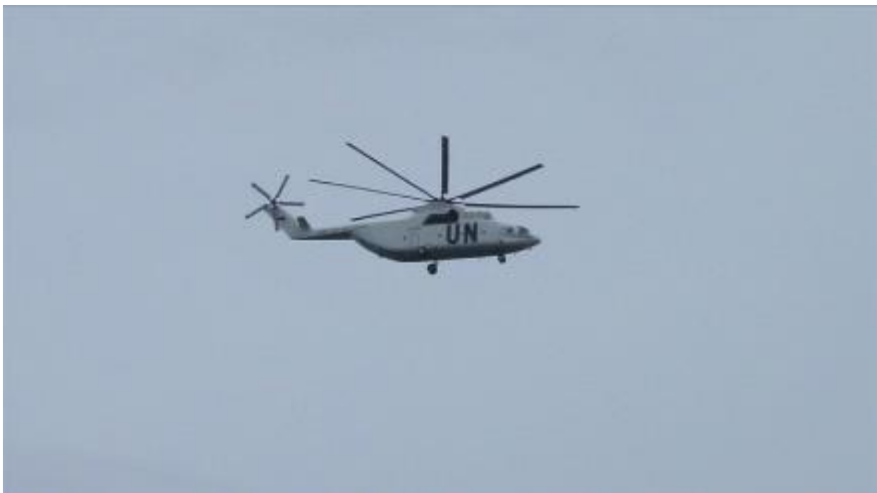
Abb.: Thomson & Craighead, A Short Film About War, 2009/2010, Film still, Courtesy of the artists.

Die Ausstellung ist eine Kooperation mit dem Forschungszentrum „Transformations of Political Violence“ (TraCe), die im Oktober 2024 mit dem Dialogpanel „Darstellungen exzessiver Gewalt – zwischen Verstörung und Attraktion“ in der Kunsthalle begann. Zur Ausstellung erscheint ein Journal, das gemeinsam von der KUNSTHALLE GIESSEN mit Wissenschaftler:innen des TraCe-Forschungszentrums realisiert wird.